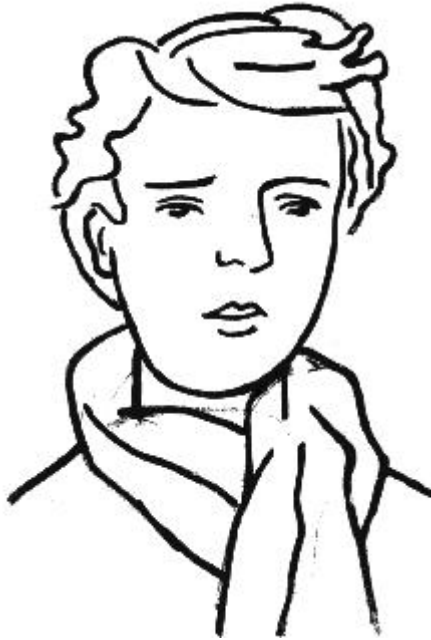
(Rimbaud par Fernand Leger)

Rimbaud (Arthur), Charleville 1854 - Marseille 1891 , poète français. Génie précoce, il vient à Paris à l'âge de dix-sept ans, porteur, avec le bateau ivre , de l'idée selon laquelle la poésie naît d'une « alchimie du verbe » et des sens. Sa liaison orageuse avec Verlaine se termine par une scène violente : blessé d'un coup de revolver, Rimbaud compose, sous le choc, les poèmes en prose d'Une saison en enfer (1873), où il exprime ses « délires ». A vingt ans, il cesse quasiment toute activité d'écrivain. Il mène alors une existence errante (soldat puis déserteur, négociant) à Java, à Chypre, à Aden, au Harar. En 1886, la Vogue publie son recueil de proses et de vers libres Illuminations . Il meurt à l'hôpital de Marseille au moment où sa poésie commence à être reconnue comme l'aboutissement des recherches romantiques et baudelairiennes. Nourrie de révolte, auréolée de légende, revendiquée par le surréalisme, l'œuvre de Rimbaud a profondément influencé la poésie moderne. Le Petit Larousse – 1999.